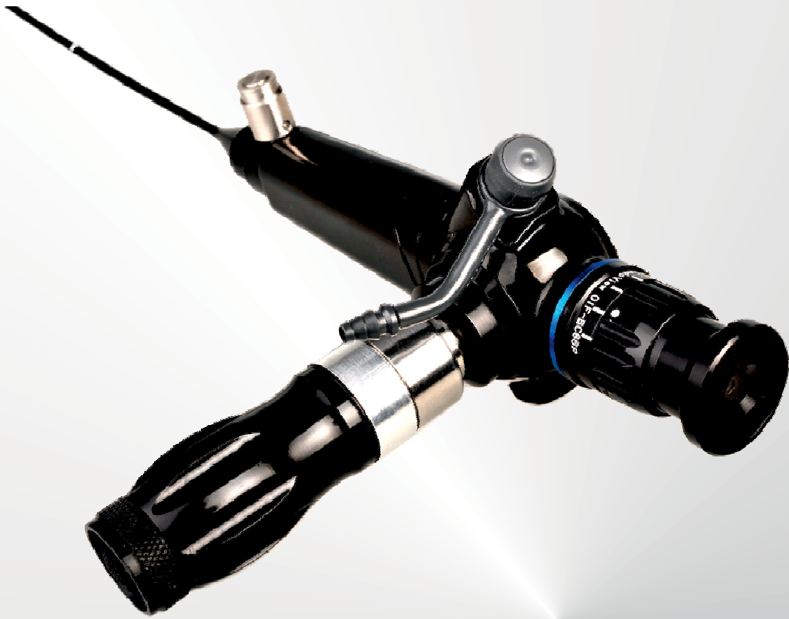
IMMAGINE AD ALTA DEFINIZIONE